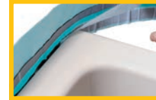
Wannenfugenband an Tasse kleben