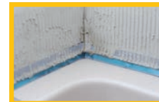
Wand mit flüssigen Dichtanstrich einstreichen