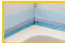
Fertig für die Fliesenlegerarbeiten