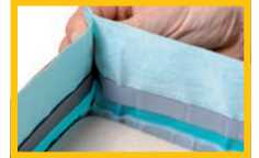
Im Eckbereich Band 1 cm falten