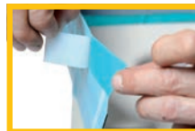
Deckband von Putzhaftkleber entfernen