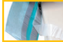
Deckband von Butylkleber entfernen